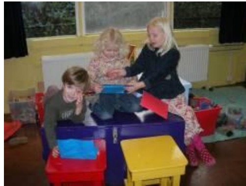
Kleuters met hun zelfgemaakte computers