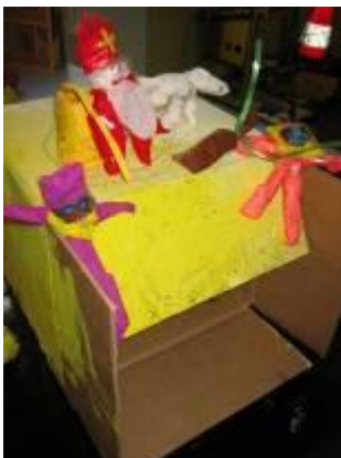
Sinthuis van Zita