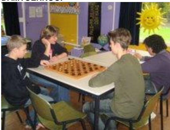
de finale van het 1 e damtoernooi